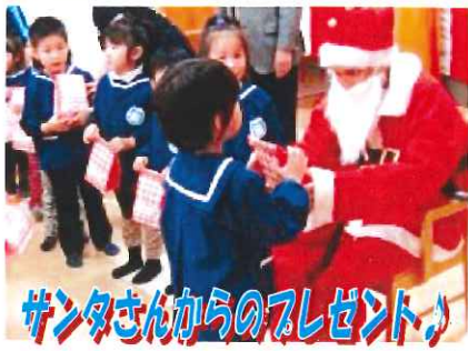
サンタさんからのプレゼント♪