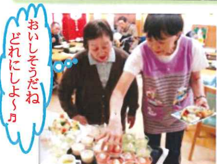
おごさうだね ムネがこころ