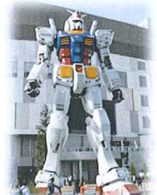
ガンダム見てきました。