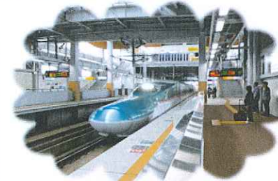
AM7：45 発 JR七戸十和田駅より出発