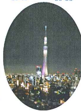
夜のスカイツリー

★スカイツリーに到着したのは15時過ぎ！夜景の時間まで自由行動しました。近くで見るスカイツリーはやっぱり大きかった♪ ★夜景が一望できるスカイツリーの展望台。本当に綺麗でした。