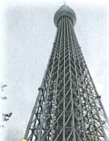
634m 浅草ビューホテル

※宿泊した『浅草ビューホテル』窓から見える（18F）夜景はよかったです。夜景を見ながらのビールは最高でした。