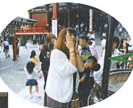
浅草にて・・・ 美容祈願♪