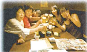
その後、夕食を楽しみ♪ 1日目終了。

※宿泊した『浅草ビューホテル』窓から見える（18F）夜景はよかったです。夜景を見ながらのビールは最高でした。