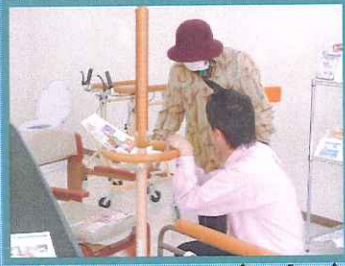
★展示コーナー★ ポジションパー (手すり)