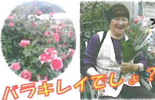
バラキレイでしょ?

七戸町にある東八甲田ローズカントリーにて、バラ園の見学とバラ摘みの体験を行いました。皆さん気に入ったバラを見付け、剪定バサミで上手にバラを摘んでいただきました。自分で摘んだバラを渡されると笑顔が見られました。