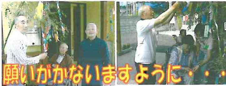
願いがかないますように...