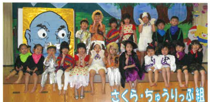
さくら・ちゅうりっぷ組

12月18日、クリスマスお遊戯会を行いました。堂々とステージに立ち、元気いっぱい練習の成果を披露しました。サンタさんからプレゼントをもらい、嬉しそうな子ども達でした。