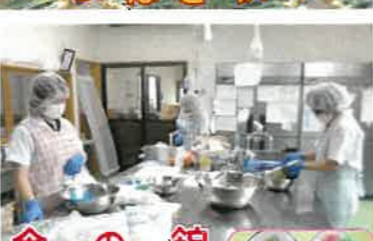
食の館 - 調理部 -