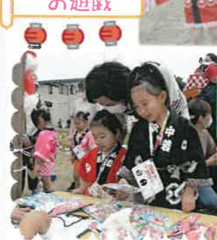
おもちゃ ヨーヨー

8月1日、新型コロナウイルス感染症拡大予防の為、今年度は保育園だけで、夕涼み会が行われました。 うちわや鳴子を使って元気よく踊ったお遊戯や5歳児の力強い和太鼓等、暑い中練習を頑張ってきた成果を発揮し、家族の方々からは温かい拍手をいただきました。 お店屋さんには親子で並び、ヨーヨーやおもちゃを一緒に選び、嬉しそうに手にする微笑ましい姿も見られ、楽しいひとときを過ごす事が出来ました。 (越後)