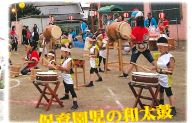
保育園児の和太鼓