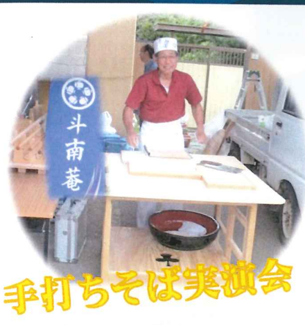
手打ちそば実演会