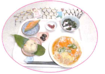
★行事食★ 七夕そうめん

7月5〜7日、七夕会を行いました。利用者の皆様は、「長生きできますように」「いつまでも元気にぽぷらに来れますように」など、願いを込め短冊を書かれました。行事食や、ゲームを楽しみ、七夕飾りの前で記念撮影を行いました。(中河原)