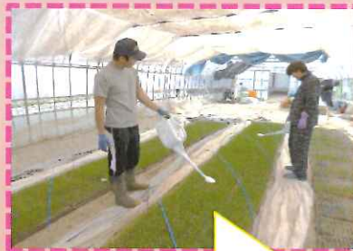
長ネギの苗に水かけ中★大きくなれよ!!

ハウスの中では、長ネギや、花の苗がぐんぐん成長しています。収穫がとも楽しみです。