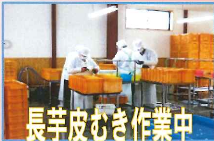
長芋皮むき作業中