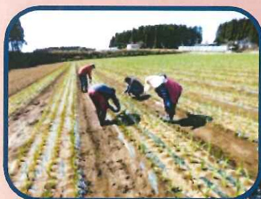
にんにくの芽はちゃんとでてるかな?

ハウスの中では、長ネギや、花の苗がぐんぐん成長しています。収穫がとも楽しみです。