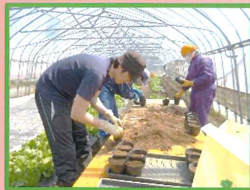
トマトポット作中