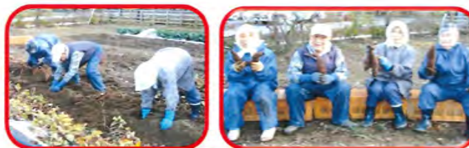
今年も大きなサツマイモが採れました!

12月15日、クリスマス会が行われました。今年も乙児保育園の園児たちが慰問に来てくださいました。女の子は可愛らしく、男の子は凛々しくお遊戯を披露する姿に涙ぐまれる方もおられました。職員手作りのクリスマスカードを子どもたちからプレゼントされると、握手した手を離さずに喜ばれていました。昼食は、ひばの里恒例のパイキングです。普段より沢山召し上がり、楽しいひとときを過ごしました。(蛭名)