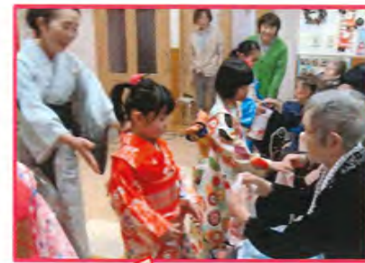
みんなで楽しく 手遊びしました★